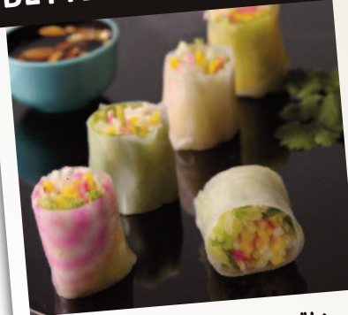
Rouleaux aux crudités d'hiver

Une chair blanche striée de rose : la reine de la déco ! À utiliser crue, en tranches fines ou râpée.