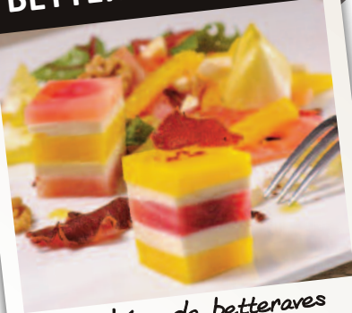
Bouchées de betteraves de couleur

La betterave tendre ! Sa couleur douce étonneront vos convives.