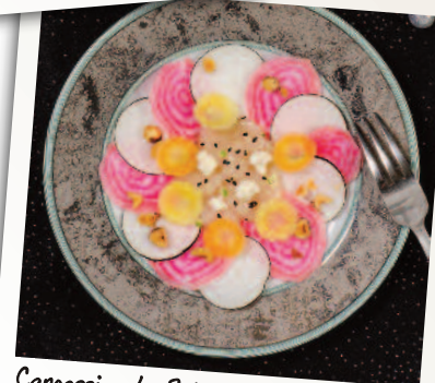
Carpaccio de Saint-Jacques, noisettes et crudités de légumes d'antan

La quintessence de la betterave rouge ! Une variété ancienne à la saveur douce, fine et sucrée et à la texture croquante.