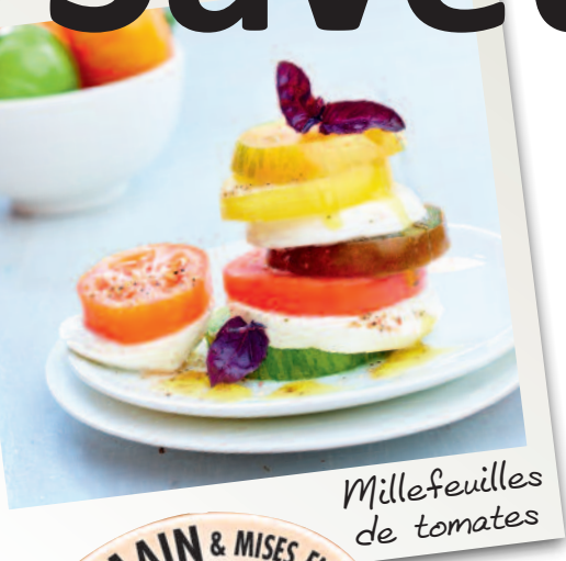
Millefeuilles de tomates