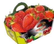
Panier carton ouvert 250g environ