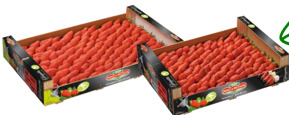
Plateaux bois lités 1 rang 2kg et 1,8kg