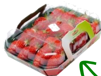
Barquette litée 250g