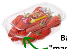
Barquette "macaron" 250g